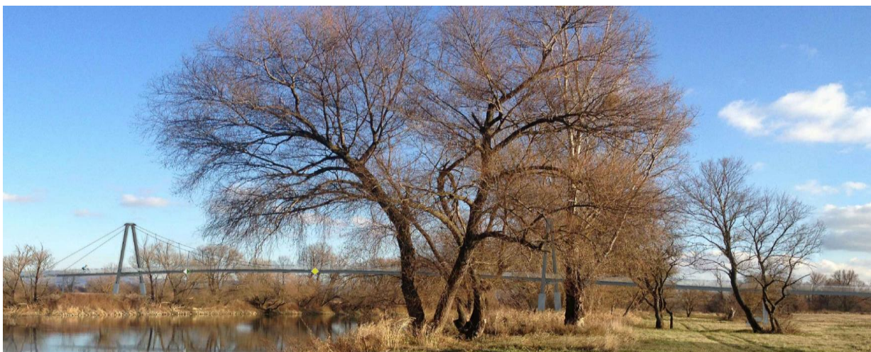
Obrázok č. 1 – Vizualizácia cyklolávky